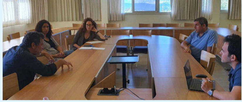
השתתפתי השבוע בפודום מנהלי קהילות, הנהלת עמותת "מרחבים",

השתתפתי בישיבת המשך בנושא פיתוח דיור עם צרכים מיוחדים במשגב.